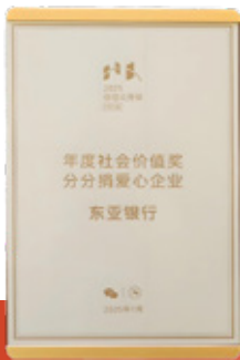
微信支付 2025年度社会价值奖-分分捐爱心企业