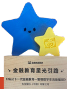
蚂蚁集团金融教育基地 2025金融教育星光引路(奖)