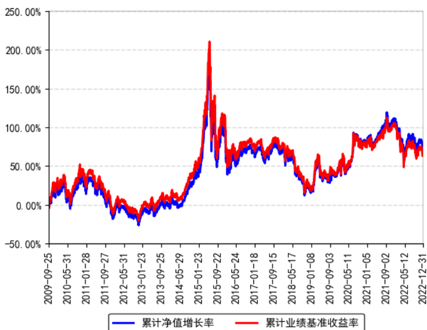
南方中证500ETF联接（LOF）A累计净值增长率与同期业绩比较基准收益率的历史走势对比图