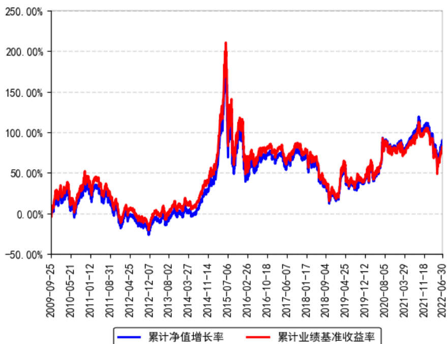
南方中证500ETF联接（LOF）A累计净值增长率与同期业绩比较基准收益率的历史走势对比图