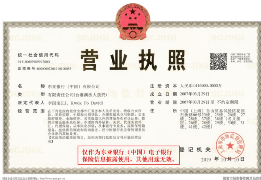
东亚银行（中国）有限公司营业执照、经营保险业务相关许可证