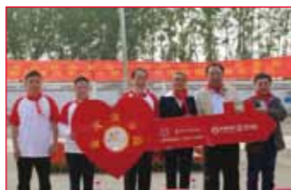
2016年10月11日 天津市蓟县别山镇 翠南庄中心小学