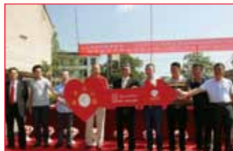
2016年9月13日 湖南省湘乡市 白田镇中学