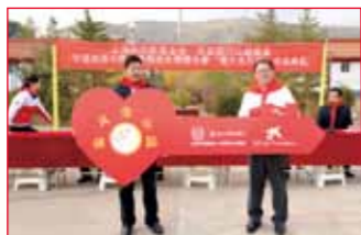
2016年10月18日 宁夏固原市隆德县 观庄乡观堡小学