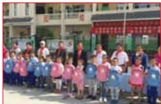
2016年9月12日 贵州省凯里市 第十五小学