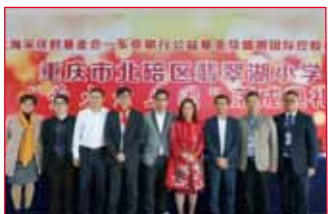
2016年10月14日 重庆市北碚区 翡翠湖小学