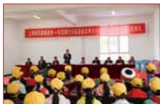
2016年9月30日 云南省昆明市寻甸回族彝族自治县 凤仪乡发来古完小