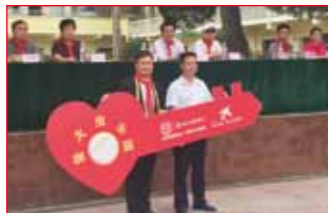
2016年9月12日 贵州省凯里市 舟溪小学