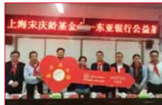
2016年9月14日 四川省成都市金堂县 竹篙镇小学