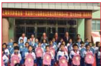
2016年9月29日 山东省日照市东港区 日照街道第四小学