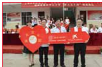
2016年10月18日 江西省上饶市横峰县 港边中心小学