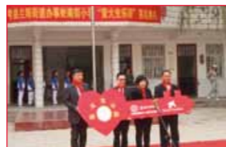
2016年10月11日 河南省兰考县兰阳 街道办事处南街小学