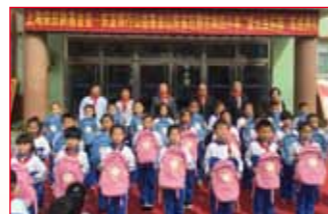
2016年10月26日 山东省泰安 第八中学