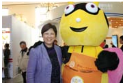
▲上海市民政局局长马伊里女士参观展区，与“萤火虫”合影

“萤火虫计划”首次推出了可爱有趣的“萤火虫”人偶，提高了人气，吸引了大量小朋友及家长对“萤火虫计划”的关注。在精心设计的“萤火虫计划”展区，通过丰富精彩的图片和实物展示，以及志愿者热情详细的讲解，向观众展示了遍布全国的“萤火虫乐园”、“萤火虫60包裹”、志愿者支教及乡村教师培训等活动。“萤火虫亮祝福”彩绘活动得到了众多小朋友的积极参与。