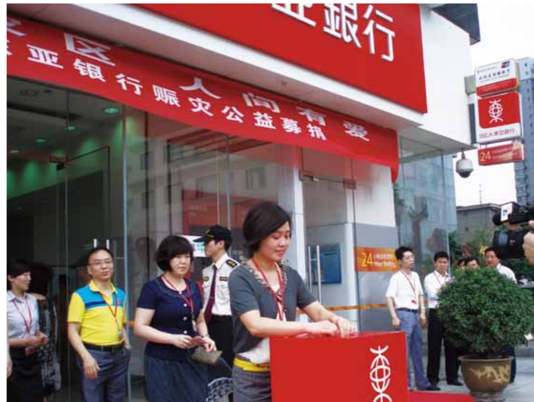
● 捐助灾区 共度难关