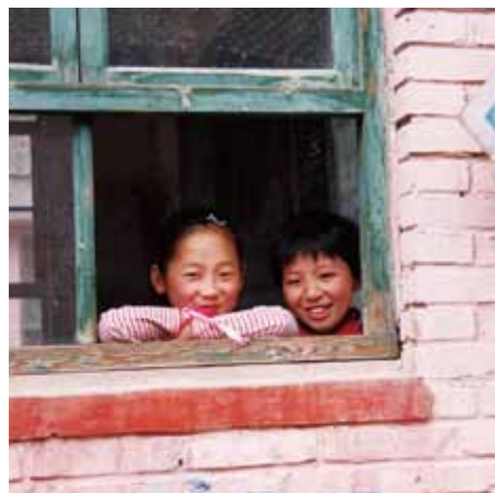
关爱山区孩子 萤火虫就在你身边

4月，北京分行联合华远会共同举办的“萤火虫就在你身边”爱心公益慈善活动，活动历时近一个月。东亚中国爱心志愿者驱车数百公里，前往河北省涞水县偏道子小学，慰问山区的孩子们。