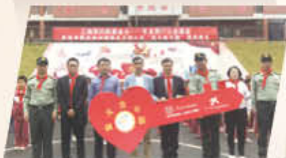
贵州省黔东南布依族苗族自治州晴隆县沙子镇光明小学