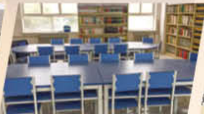
甘肃和政县梁家寺东乡族学校