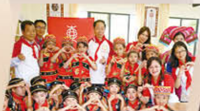
广东省清远市连山壮族瑶族自治县三江镇中心小学