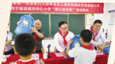
江西省赣州市于都县银坑中心小学