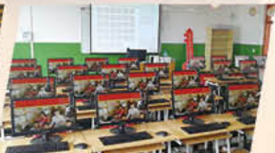
宁夏吴忠市同心县石峡镇满春小学