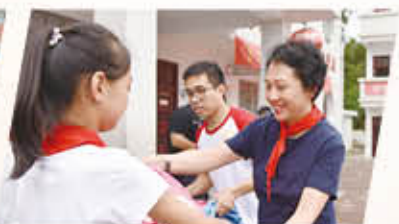
安徽省六安市金寨县花石乡中心小学