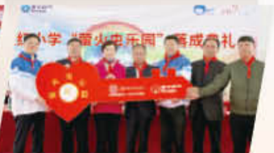
云南省曲靖市罗平县红小学