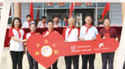
天津市蓟州区桑梓镇初级中学