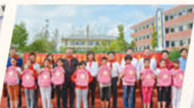
安徽省合肥市肥东县马湖学校