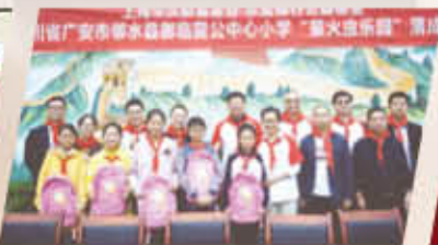
四川省广安市邻水县御临雷公中心小学