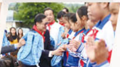
四川省成都市金堂县又新镇又新学校