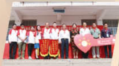
广东省清远市阳山县黄盆老区学校